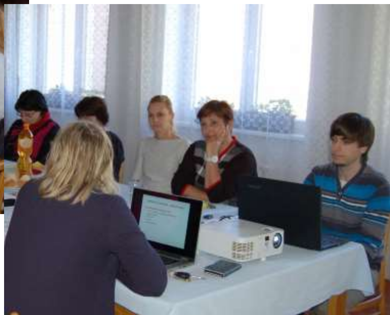
Projekt Střednědobé plánování