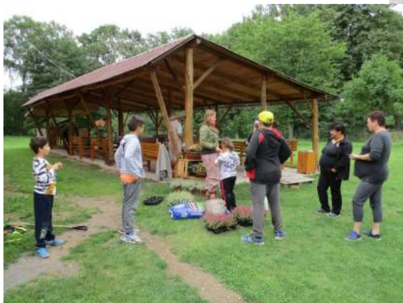
Projekt Komunitní práce