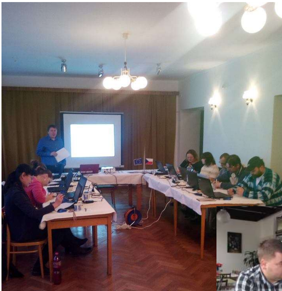
Projekt Sociální začleňování